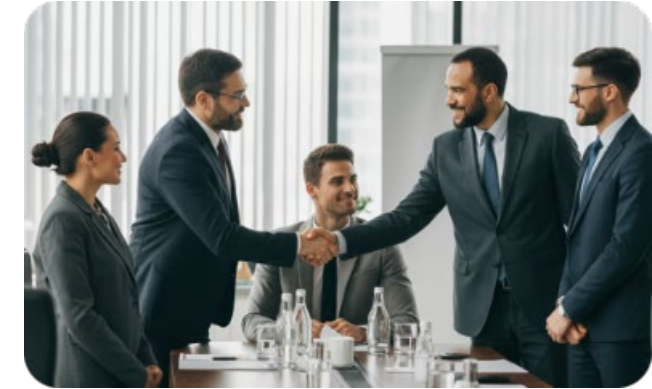
Construir relaciones con las agencias gubernamentales