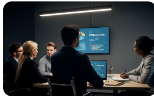
Conocer la competencia