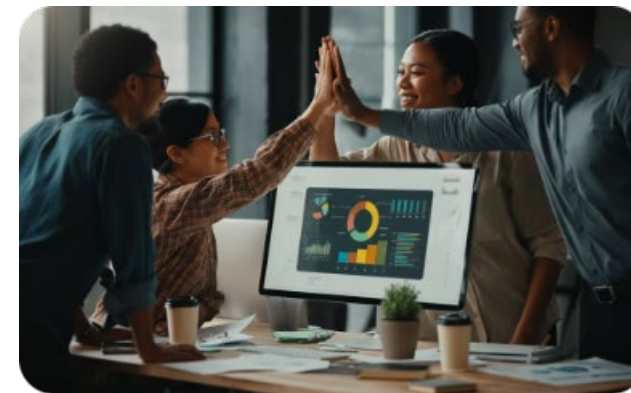
Desempeño positivo en la ejecución del contrato