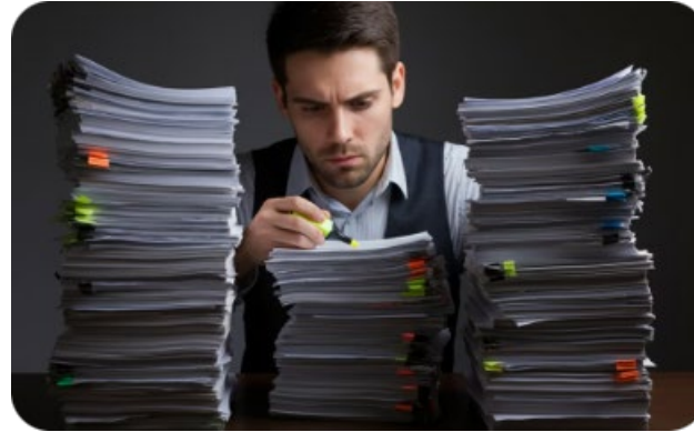
Mantenerse informado de cambios regulatorios