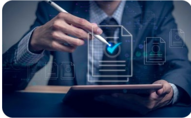
Entender el proceso de compra